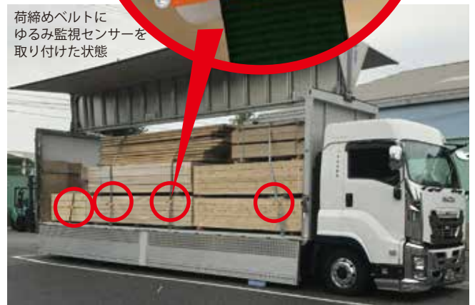
ゆるみセンサー取り付け例