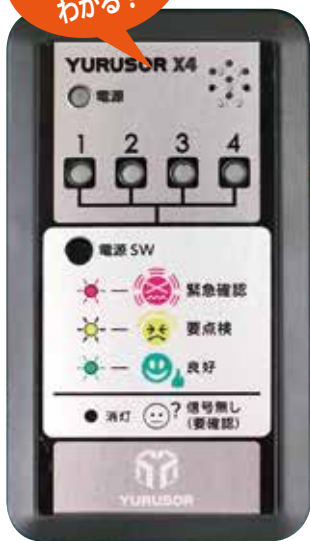
運転席側モニター