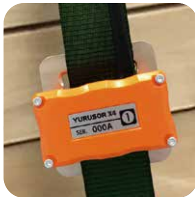
ゆるみ監視センサー